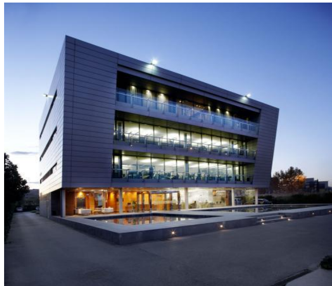
Sede de Indukern en el Polígono Mas Blau en El Prat de Llobregat (Barcelona)

Indukern factura 425 millones de euros. El 60% procede de operaciones internacionales, principalmente de Europa (22%) y Latinoamérica (32%) –donde es una compañía de referencia en países como Brasil y México-, y el 40%, del mercado nacional.