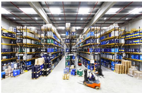
Instalaciones de Indukern en la Zona de Actividades Logísticas (ZAL) del Puerto de Barcelona